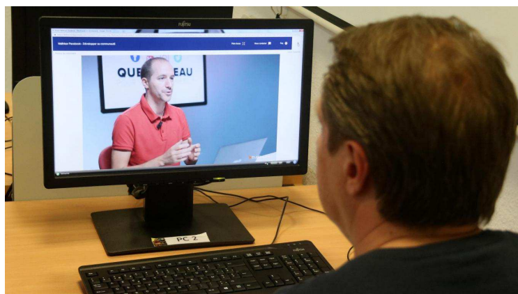
Face à face avec son professeur de langue. - David Claes

On peut aussi s'initier au solfège, au dessin, à la programmation... en compagnie de professeurs virtuels qui vous expliquent tout de « A à Z ». Un monde de connaissances à portée de clic !